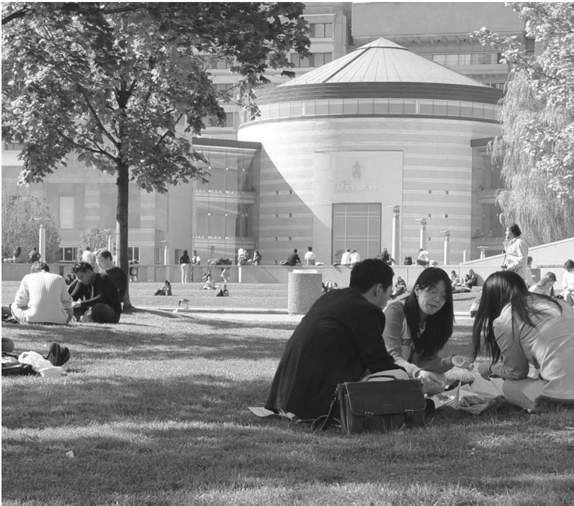
Business Park và cuộc sống cộng đồng

Business Park luôn tìm kiếm sự hòa nhập với cộng đồng để cùng nhau phát triển.