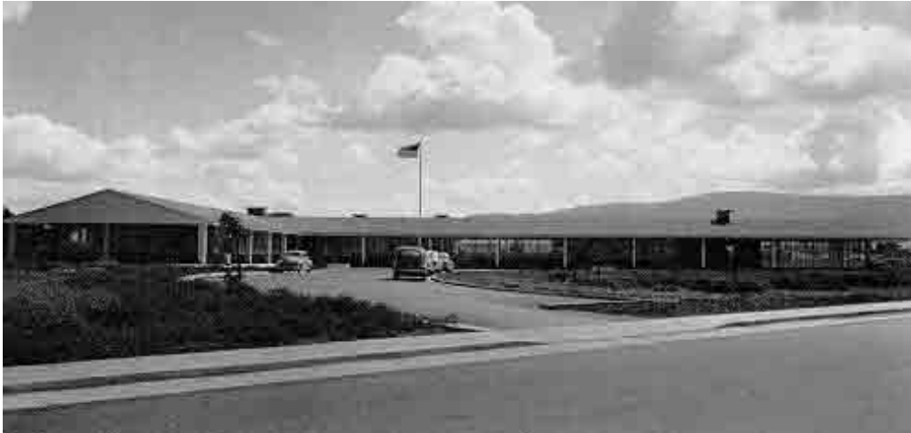
Tòa nhà đầu tiên của công ty Varian Associates được xây dựng tại Khu công nghiệp Standford năm 1953

công nghiệp trong thành phố và họ coi ý tưởng xây dựng một Khu nghiên cứu khoa học riêng biệt, sạch sẽ như là một giải pháp mới thúc đẩy phát triển kinh tế xã hội.